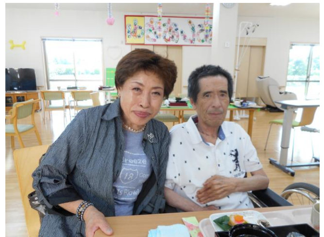
ご家族と食事。素敵な笑顔ですね！！