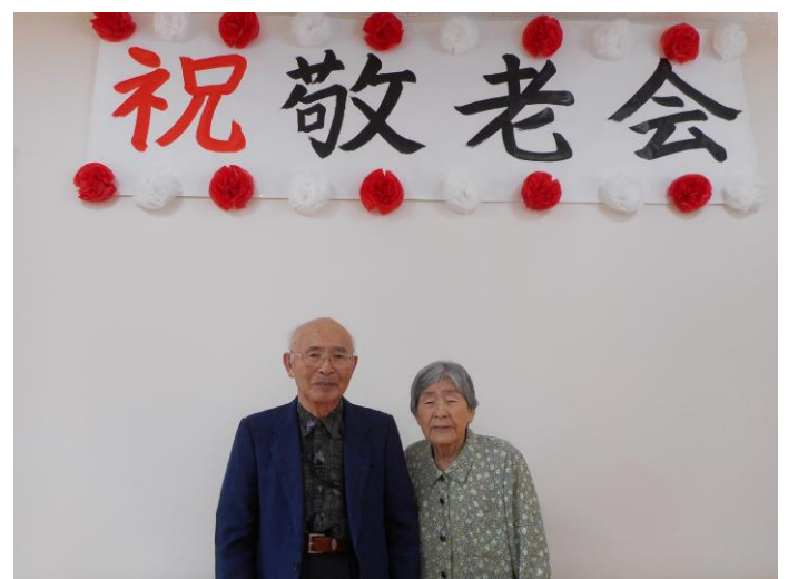
いつまでも健康で長生きしてくださいね☆