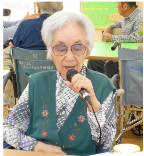
素敵な歌声ですね～♪♪