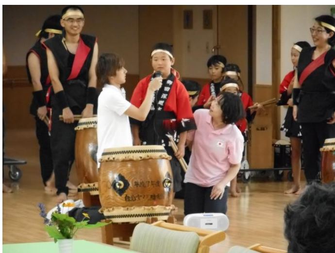
迫力ある和太鼓演奏が心に響きました。