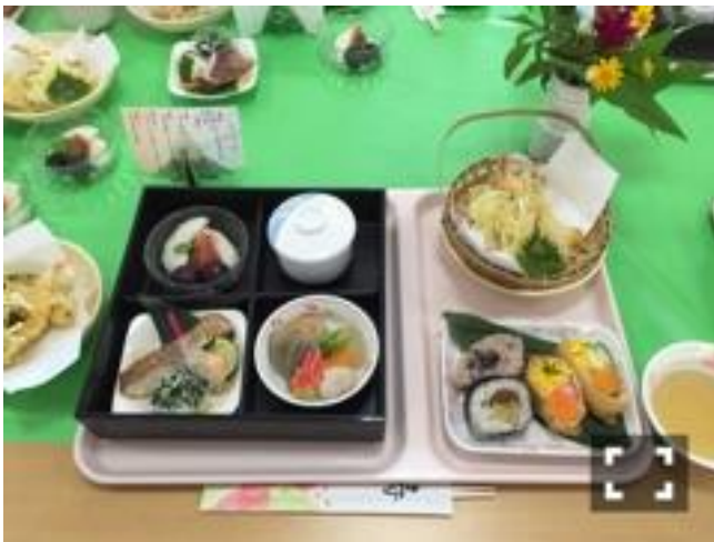
長寿のお祝 - おもてなし料理 -