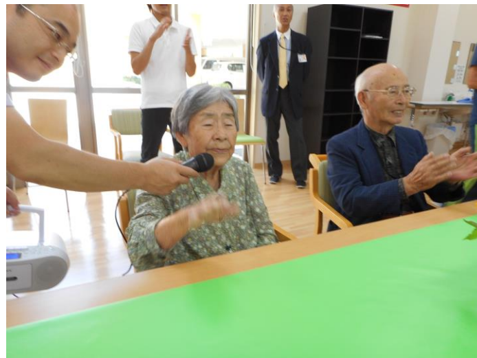
カラオケも楽しかったですね♪