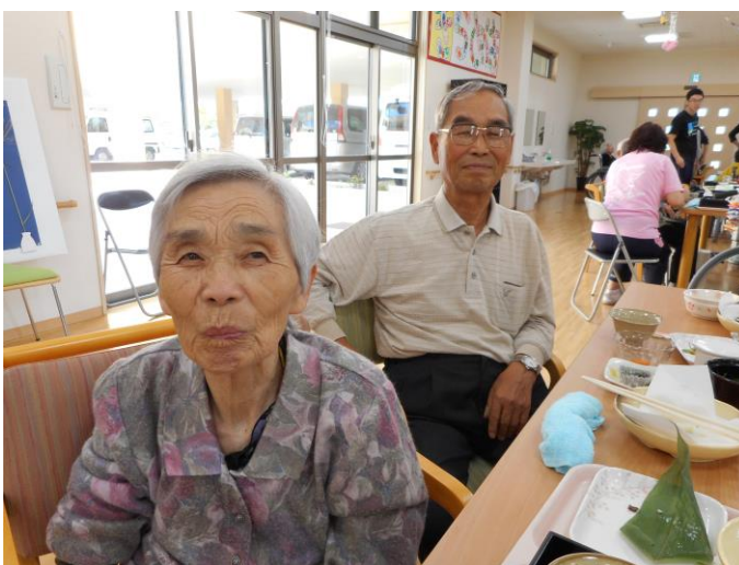
また来年も楽しみましょうね。