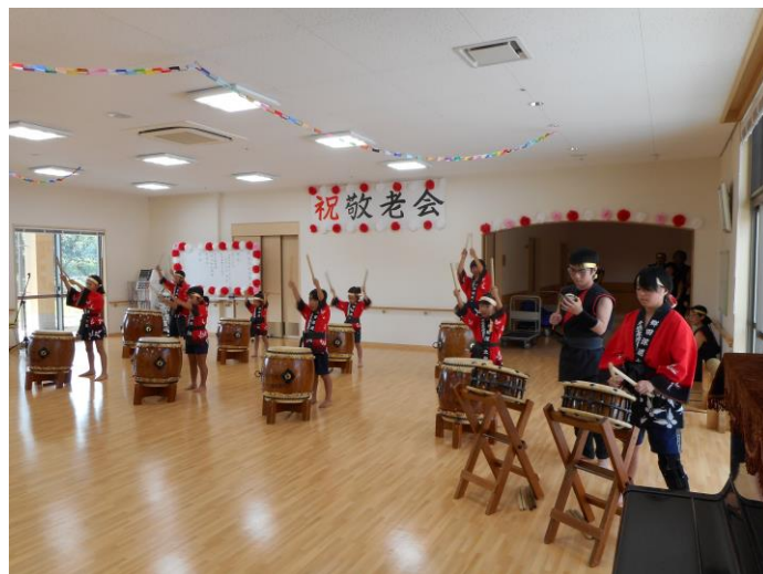
一打一打心を込めた演奏、ありがとうございました。