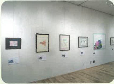
額に入れて飾ると作品も一段と引き立ちます。