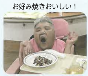
お好み焼きおいしい！