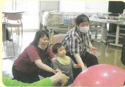
みんなで風船バレー