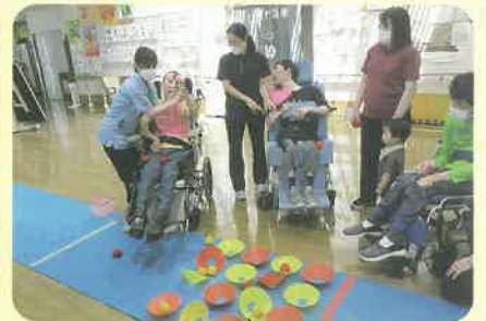
玉と同じ色のカップに投げるよ

スポーツ交流センターおりづるより講師の方をお迎えし 定期的にスポーツレクリエーションを行っています。