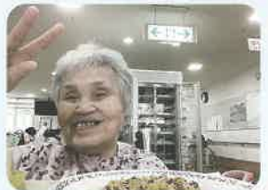
お好み焼きと一緒にピース！