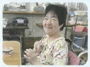
すごくおいしかった！