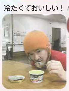
冷たくておいしい！