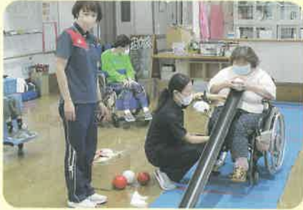
ボールを転がしてピンを倒すよ