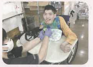
いっぱい食べたいな！