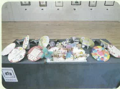
円形の作品は「地球」をモチーフに折り紙や写真を貼りました。中央の編みぐるみもご利用者様の作品です。

東広島芸術文化ホールくららにて第19回絵画作品展～仲間展～を開催しました。施設内は新型コロナウイルス対策にて満足のゆく活動時間を確保することが難しい時期が続きましたが、「絵を描くことが大好き！」という気持ちで活動日には一生懸命作品作りに取り組み、作品展が近づくと皆様楽しんで準備されました。