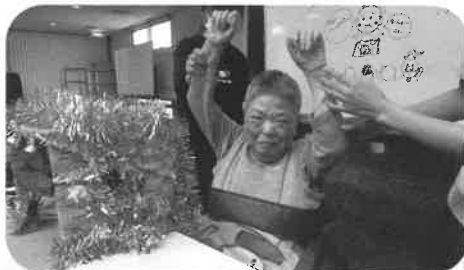
箱の中身はお花でした! 正解