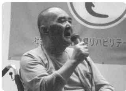
こぶしをきかせて～。