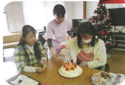
各テーブルの良さが表れた 素敵なケーキができました！