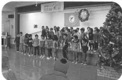
見てるだけで元気をもらえます!!