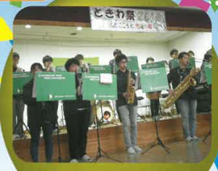
広大吹奏楽団♪迫力に圧倒 されました！