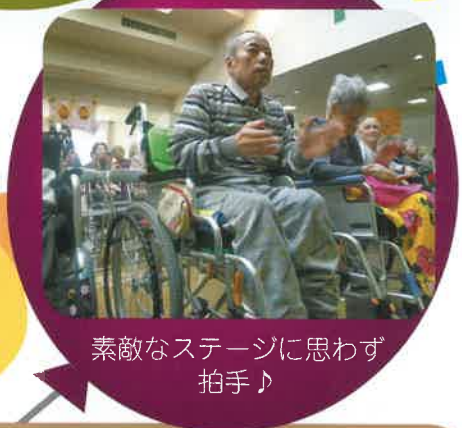
素敵なステージに思わず 拍手♪