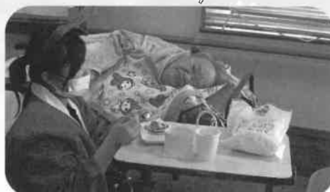
サンタさんからモンブランのプレゼント