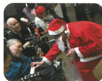
サンタクロースからのクリスマスプレゼント！やったー！