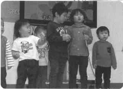
多世代の子ども達で「アイアイ」♪

毎年恒例のカラオケ交流会を開催しました！ 昭和の名曲から平成のヒット曲まで歌ったり踊ったり…。参加された方は、日頃の練習の成果を十分に発揮されました。