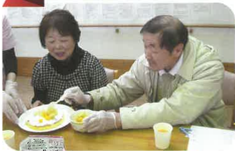
今年はケーキ作り&ピンゴ大会 楽しいひとときとなりました♪