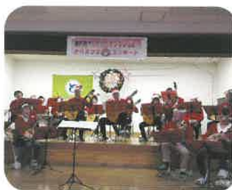
ギターマンドリンの皆さまによるアンサンブルの美しい音色についつい聞き惚れてしまいました♪