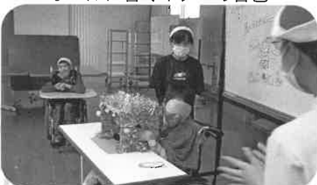
箱の中身はなんですか??