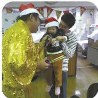
ピンゴ1番おめでとう！