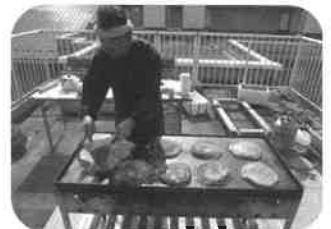
もうすこしで完成です