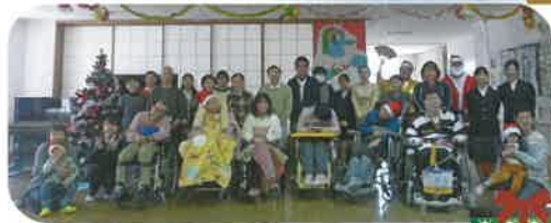
記念に1枚ハイチーズ ✨