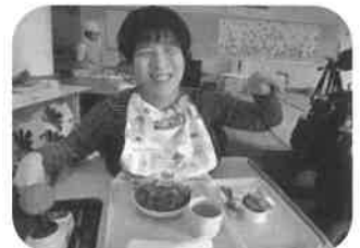
美味しそうな匂い♡

今回のお楽しみ昼食会は「お好み焼き」を各棟で実施しました。鉄板で焼くアツアツの美味しいお好み焼きを堪能しました!!!