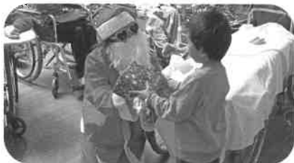
イケてるサンタさんからのプレゼント

原保育所さんと楽しい交流会を行いました。今回で16回目となった交流会ですが、今年も子どもさん達の元気な踊りで笑顔をもらえました。お礼にサンタさんからのプレゼント!子どもさん達も喜んでいただき、とても楽しい交流会となりました。