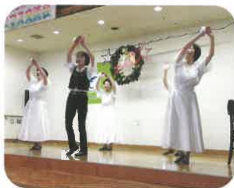
アイ・サン・サンの皆さんによるフォークダンスです。とっても楽しい踊りとそのリズムにのってしまいました！

今年も、午前は東広島パイロットクラブの皆様とお仲間による楽器演奏、フォークダンス、エイサーと、午後は東広島マンドリンアンサンブルの皆様によるマンドリン、ダンスなど、ギターとマンドリンの美しいアンサンブルの音色を鑑賞しました。そして、サンタさんからクリスマスプレゼントもあり、楽しく素敵な1日となりました。