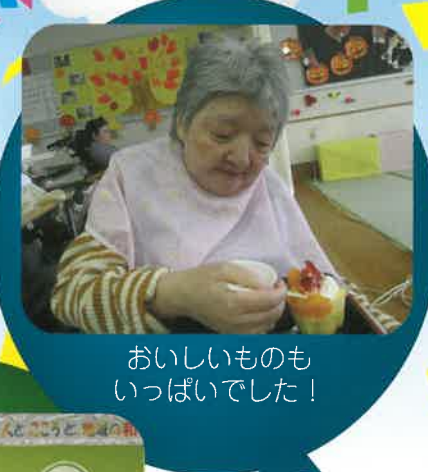
おいしいものも いっぱいでした！