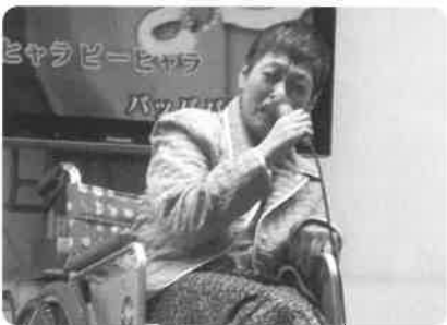
ちょっぴり緊張します。