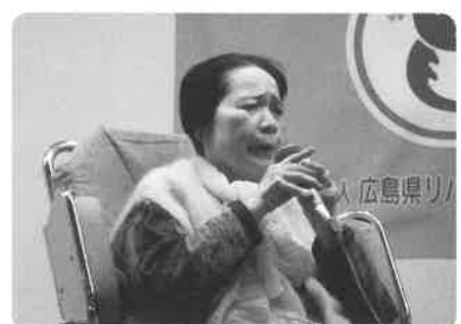
美しい歌声を響かせます。