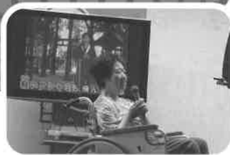
十八番はリンゴの唄

ときわ台ホームとのぞみ会、いろは会のみなさまでカラオケ交流会を行いました。参加されたみなさんは日ごろの練習の成果を出せましたでしょうか? 来年に向け新しいレパートリーを増やしてみたり、得意の歌に磨きをかけて来年またお会いしましょう!