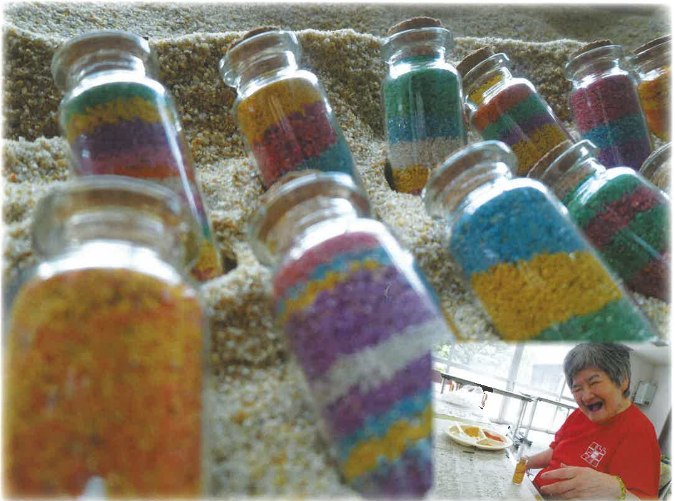
活動で小ビンに色砂を詰めました🌻