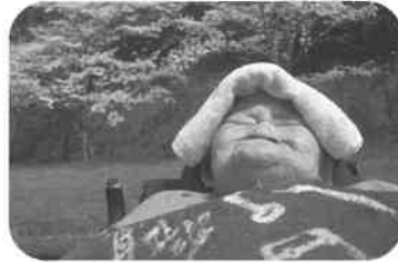
ほかほか陽気で気持ちいい～

4月11日に桜の花を見に皆で外へお散歩へ出掛けました。天気も良くとてもきれいな桜が咲いていましたが中でもしだれ桜が美しく、思わず見とれてしまいました。