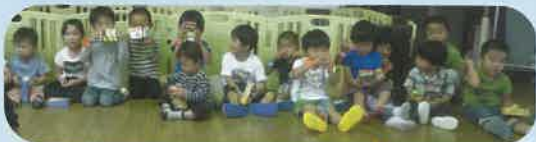
みんなでハイ、ポーズ ✨

今年も多世代を利用してきている子ども達とステージで歌等の発表をさせていただきました♪いつものように元気一杯の姿を保護者さんと見ていただけました ✨ 終了後のプレゼントには満面の笑みをみせてくれた子どもたちでした♥