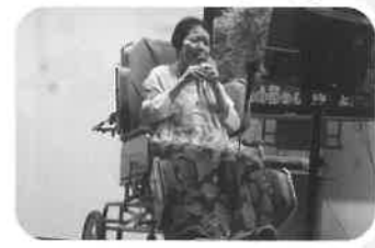
いつも以上に心にひびきます。

ときわ台ホームとのぞみ会、いろは会のみなさまでカラオケ交流会を行いました。参加されたみなさんは日ごろの練習の成果を出せましたでしょうか? 来年に向け新しいレパートリーを増やしてみたり、得意の歌に磨きをかけて来年またお会いしましょう!