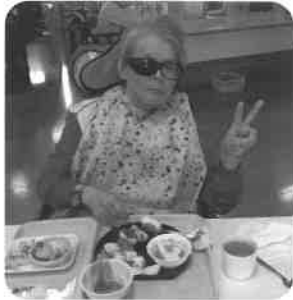
花見の後のご飯はおいしいね!

4月11日に桜の花を見に皆で外へお散歩へ出掛けました。天気も良くとてもきれいな桜が咲いていましたが中でもしだれ桜が美しく、思わず見とれてしまいました。