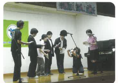
劇団四季報！開演～ 「不思議な薬」