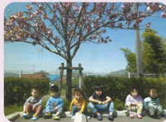
上手に並んでくれました