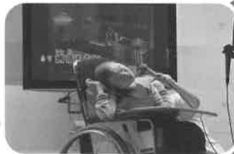
ムーディーな雰囲気