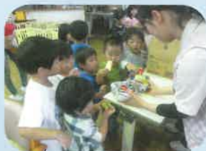
幸せなら手をたたこう♪ お菓子と手作り時計のプレゼント♥