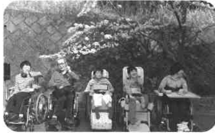
桜の下で、はいチーズ!