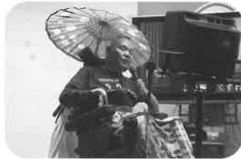
歌ってみせます男道…