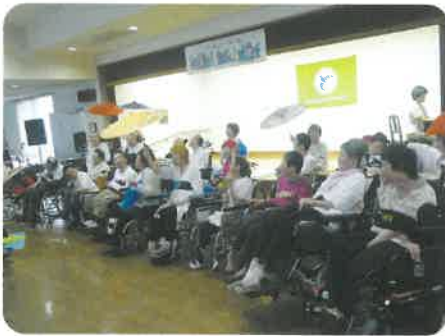
今年は雨がテーマです ☂