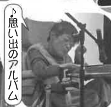
♪思い出のアルバム