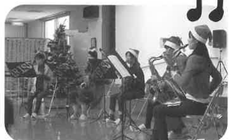
東広島ウインドアンサンブル“イーリス”様のサクソ演奏