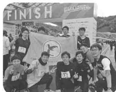
団結パワーで来年も頑張ります♪