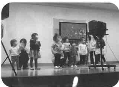
子ども達のパワーで元気いっぱい!