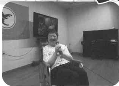
素敵な歌声でした♪