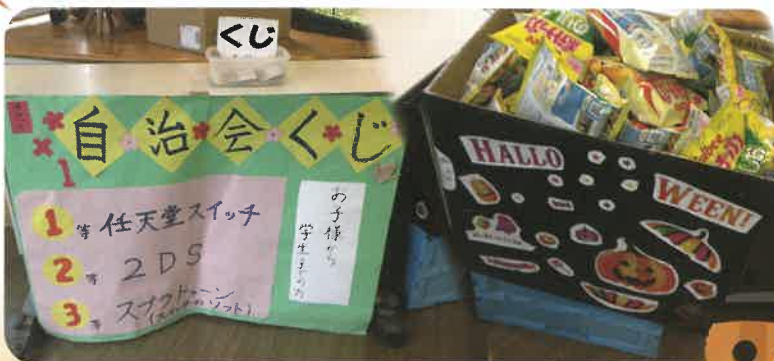
遊びに来てくれたみんなへ。