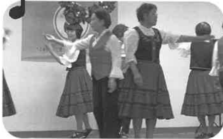
愛さんさん様のダンス

パイロットクラブ・東広島ウインドアンサンブル“イーリス”・六方学園・愛さんさんの皆様をお招きし、楽しいダンスから美しいアンサンブルの音色まで、皆さん夢中になって音楽の一日をすごしました。