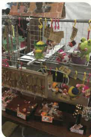
かわいい雑貨屋さんみたいだね。