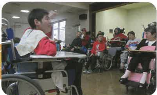
一生懸命歌ったよー♪

この度もときわ祭 2017 にご来場頂き、ありがとうございました。今年の模擬店は、カレーうどん、チャーハン、アイスクリームぜんざいなど例年とはひと味違うメニューが並び、利用者さんにも大変喜んで頂くことができました。また来年度へ向けてさらなる新メニューの開発と利用者さんの活動発表の充実に努めてまいります。