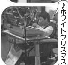
♪ホワイトクリスマス