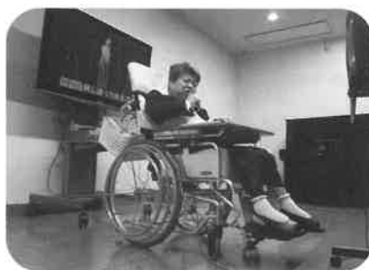
みんなのハートをわしづかみ♥