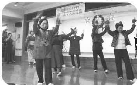
パイロットクラブ様のダンス