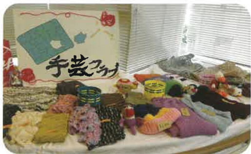
色鮮やかでとってもきれい!!