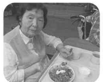
とっても美味しいわ