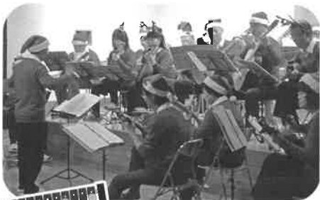
東広島マンドリンアンサンブル様の演奏