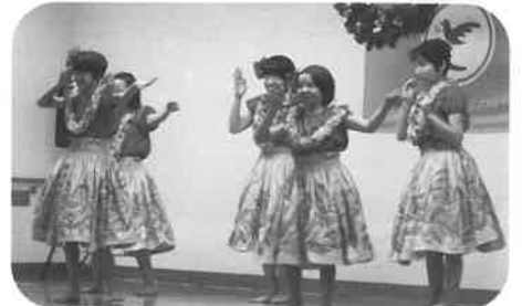
六方学園様のフラダンス

パイロットクラブ・東広島ウインドアンサンブル“イーリス”・六方学園・愛さんさんの皆様をお招きし、楽しいダンスから美しいアンサンブルの音色まで、皆さん夢中になって音楽の一日をすごしました。