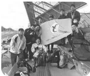
ときわ台ランナーズのみなさん

結果は3時間24分。見事制限時間内に完走することができました。完走したことでより職員同士の連携が強くなったようです。ぜひ仕事にも活かして下さい!!