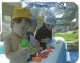
水鉄砲で、お水をお魚に当てられるかゲーム♪