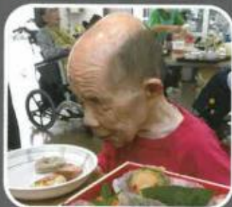
味わっていただいています