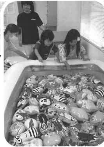
ふうせん釣りは何を釣ろうかまよっちゃう。