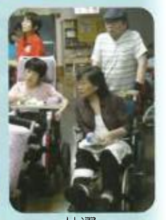
抽選、当たりますように!