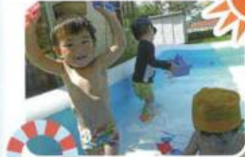
お魚つかまえたー!!