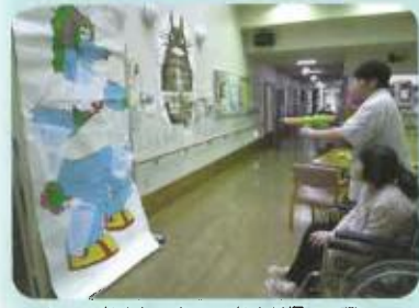
しっかり、しっかり狙って...