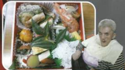
食べて食べて元気モリモリ!!!