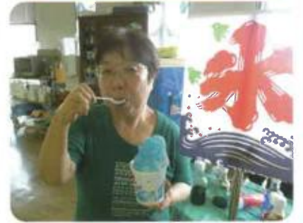
キャンペーンガールも大満足!!