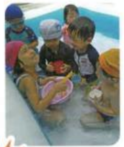
皆でプール♪ 楽し〜い♪

今年も子ども達が楽しみにしているイベントの一つ! 水遊びが始まりました! 皆全力で水を楽しんでくれました♪