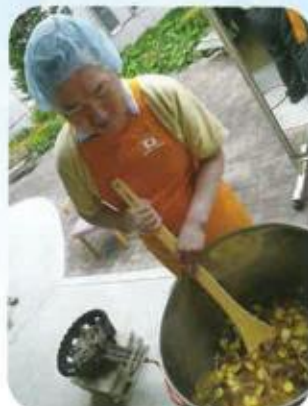
時間かけてゆっくりと…