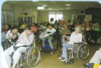
いい匂いが包みます

いちから一生懸命育てた野菜達が大きくなりました。みんなで収穫した野菜を使ってカレーを作りました。切ったり、焼いたり、煮込んだり、とてもおいしい、世界でひとつのカレーが完成しました。