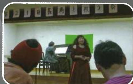
メソソプラノの美しい声にうっとり・・・