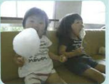
みんなで集合、ハイチース!