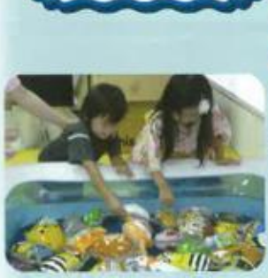
浴衣でヨーヨーつり♪