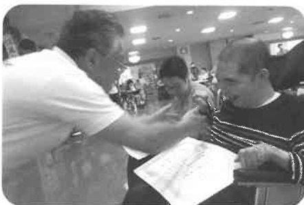
優勝はカープ坊やチーム!! 優勝おめでとうございます!!!!