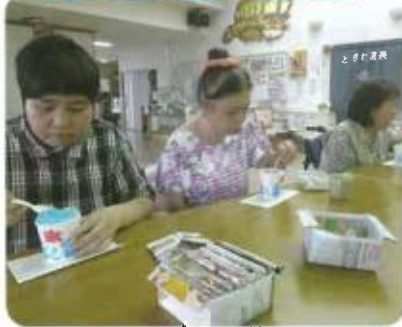
皆で食べるとおいしいです