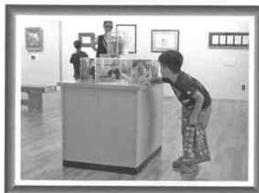
活動の様子をおさめた写真も大好評!