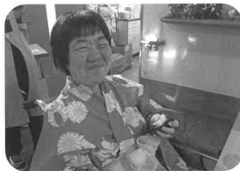
お気に入りの浴衣を着て食べると ウキウキしますね！

年々本格さが増すおばけ屋敷や、カープ応援メニューの鯉勝丼と、今年も熱く盛り上がり、多くの方々に夏まつり二〇一七を楽しんで頂きました。