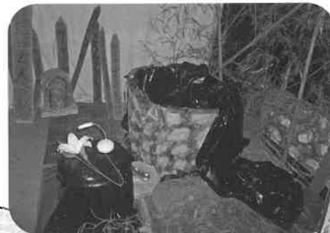
この井戸から…出たあ～

年々本格さが増すおばけ屋敷や、カープ応援メニューの鯉勝丼と、今年も熱く盛り上がり、多くの方々に夏まつり二〇一七を楽しんで頂きました。