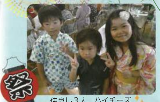
仲よし3人、ハイチース