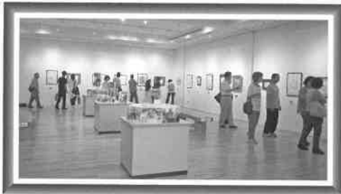
「この絵、力強いね」「色使いが良いねえ」と賑わいました。