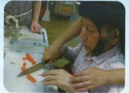
切るのはまかせて

いちから一生懸命育てた野菜達が大きくなりました。みんなで収穫した野菜を使ってカレーを作りました。切ったり、焼いたり、煮込んだり、とてもおいしい、世界でひとつのカレーが完成しました。