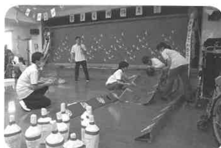
たくさん投げるぞ!!