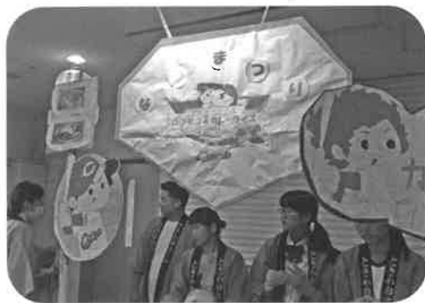
カープ応援メニュー 鯉勝丼、即完売でした！ ありがとうございました。