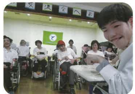
私たちが利用者コーラス「ハッピー」です