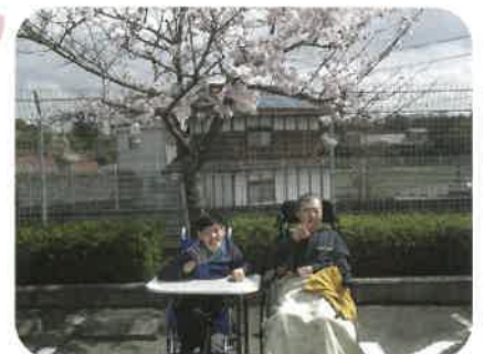
男二人で楽しむ桜もまた…