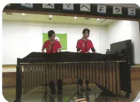
木の精が歌っているかのような自然なひびき