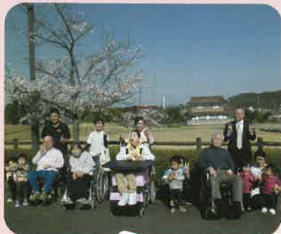
みんなで一緒に、ハイチーズ