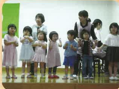
大きな声で頑張りました！