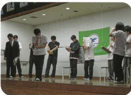
初登場! 劇団四季報による寸劇「不思議な力」