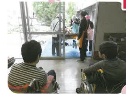
焼きそばのソースのいい香りが漂います

開花が心配された今年の桜でしたが丁度よく、観桜会ではみごとに満開となり私たちの目を楽しませてくれました。花より団子の方は焼きそばやお寿司、ステーキに舌鼓♪来年もまた満開の元で開催できますように!!