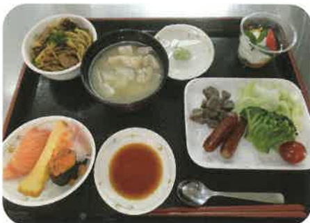
おいしいとこどりランチです!!