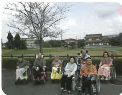
花見日和でみなさん笑顔 ^u^