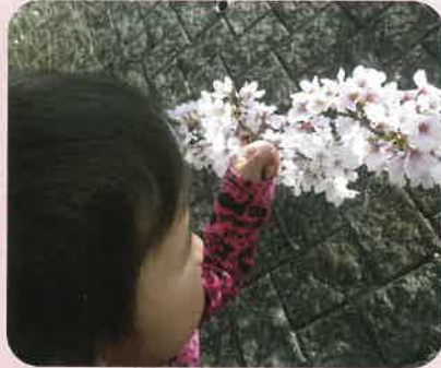
桜の花びらって、つるつるなんだ〜♪