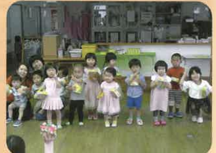
みんなで集合、ハイチーズ！