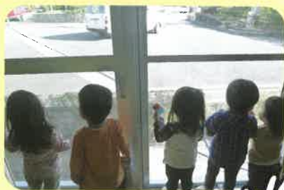
みんなでお見送り♪ 「バイバイ!!」