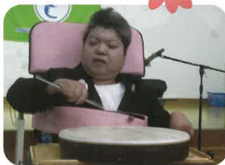
メロディに合わせて ポン!