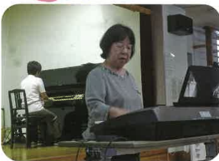
ちょっぴり緊張するな～。

今年も皆さんお待ちかねの「花の交流会」が開催されました。今年、ピアノ教室の生徒さんによる演奏やマリンバ演奏、そして職員による寸劇があり、たくさんの笑顔の花が咲いた1日となりました。