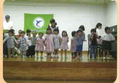
お父さん、お母さんに見てもらい一段と張り切っています。

今年もステージ上で歌や体操を披露させていただきました。日頃の練習の成果を出し切った子どもたち！終了後はごほうびのお菓みに満面の笑顔でした。沢山の方々にご参加いただき、素敵な一時となりました♪