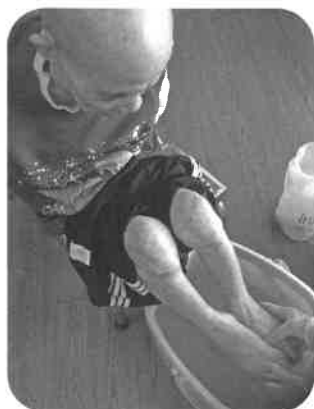
お湯かげん いかがでしょう?