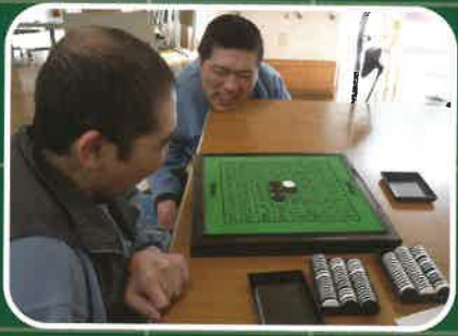
ゆっくり、まったりと。