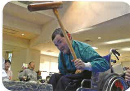
美味しいおもちをつくぞ～！

午前はおもちつき、午後からは三味線&しの笛の演奏がありました。その後は、午前についたおもちが入ったぜんざいやお菓子を食べて一年の幕あけを祝いました！