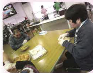
上手に握れました!