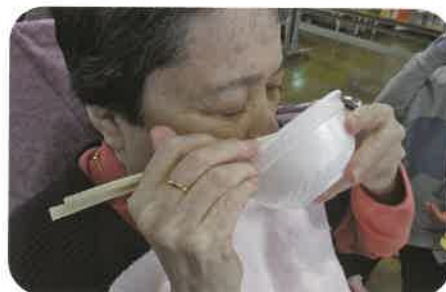
心も体もあたたまります