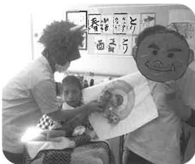
協力して福を内に。