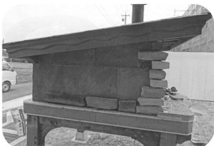
⑦外壁を装飾します。