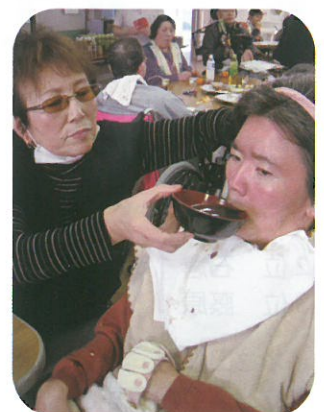
何杯でも食べられそう♡