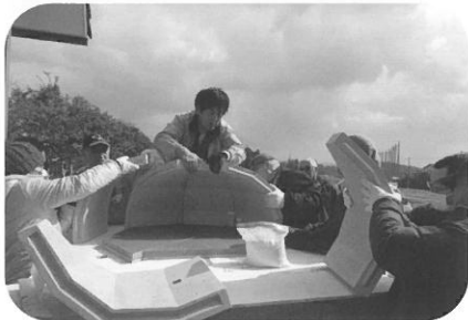
④ドームを組み立てます。