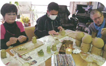
陶芸作品作りの手伝い