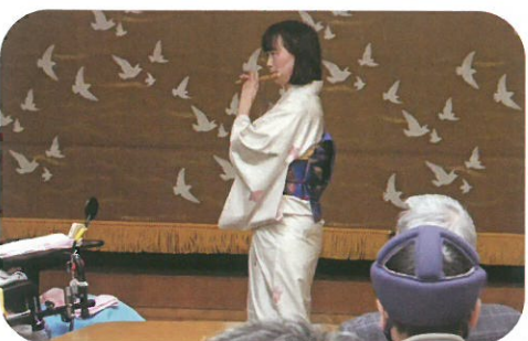
しの笛のきれいな音色です♪