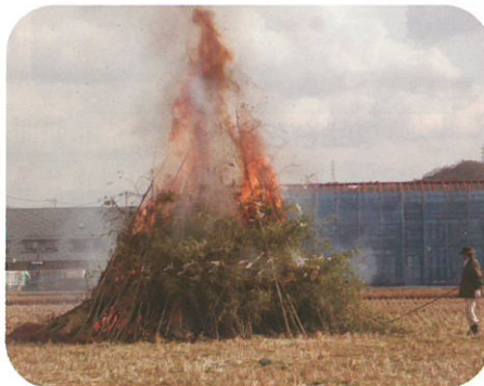
勢いよく燃え上がりました！