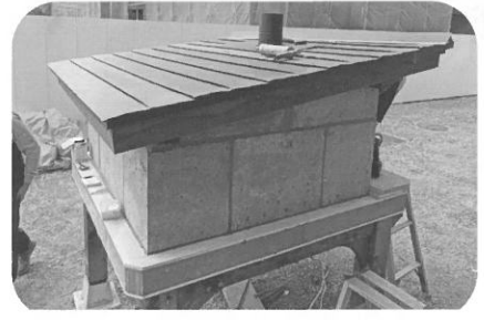
⑥ドームの周りに壁と屋根を作ります。