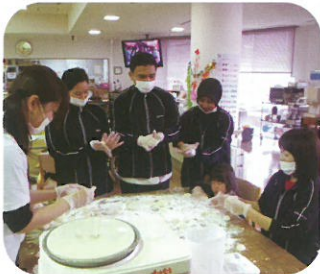
みんなでお餅をこねこね♪

今回もみなさんから「おいしい」の言葉と笑顔をいただきました。これからも楽しみにしていただける行事として続けていきたいです。