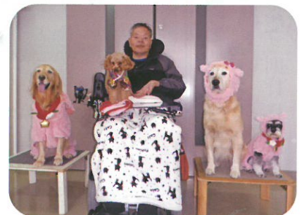
カワイイ♡ワンちゃんたちとハイチーズ！