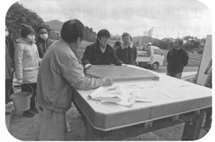
③石窯の床の部分です。