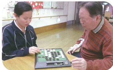
利用者さんとオセロ