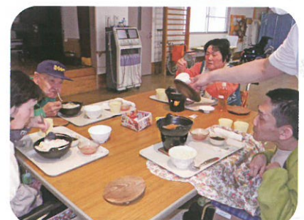
心も体もほっかほか♡