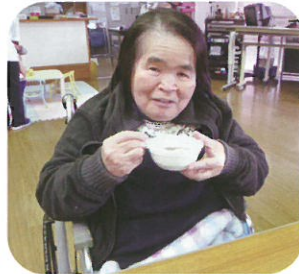
お餅もたくさん入って、おいしいね!!