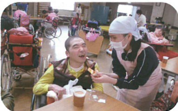
ニコニココーヒーでのおやつ介助