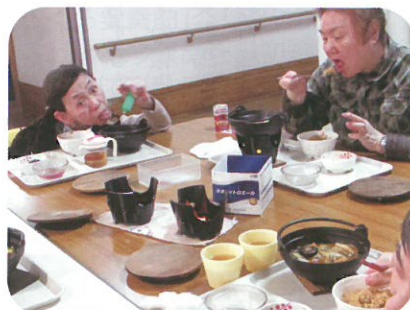
アツアツ鍋 美味しいよ♪