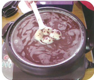
おいしそうにできました!