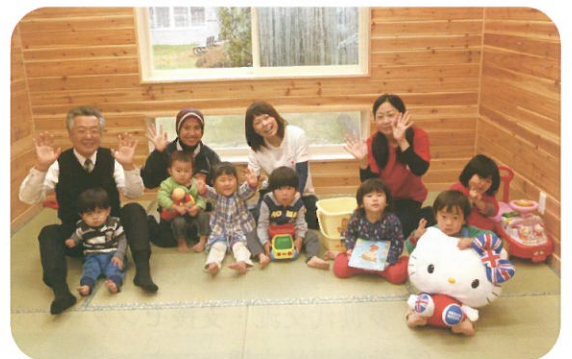
みんなで楽しく遊ぼうね!

多世代交流の中の、子育て支援として託児室ができました。みなさまのご利用お待ちしております。