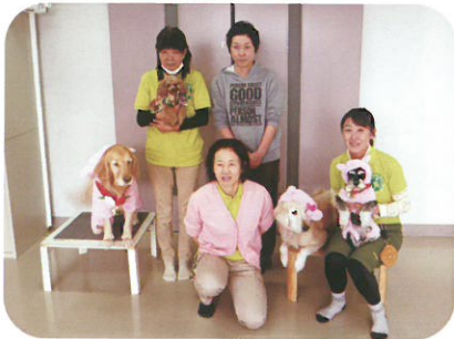
アニマルセラピー協会の方々