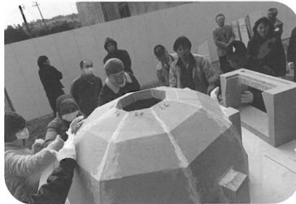
⑤ドームのできあがり!