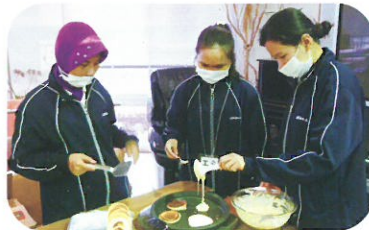
パンケーキづくり