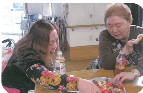
どれが良いか迷っちゃうなあ〜