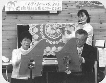
素晴らしい演奏でした♪