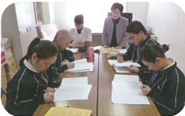
日本語学習の時間

日本語の勉強とあわせて施設の様々な活動等にも参加し、日本にも施設にも慣れていただけるよう、取り組んでいます。