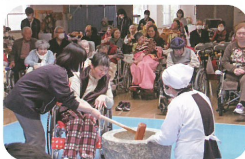
おいしいおもちが出来るといいなあ!!