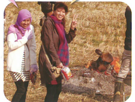
とんどの火にあたって暖まりました♪