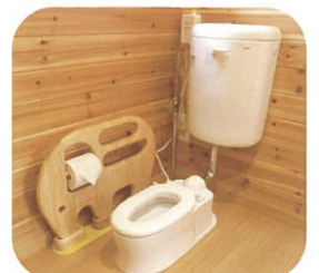
そうさんがかわいいトイレ☆