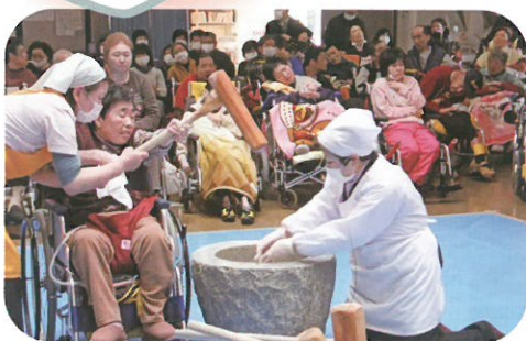
がんばれ、がんばれ〜!!